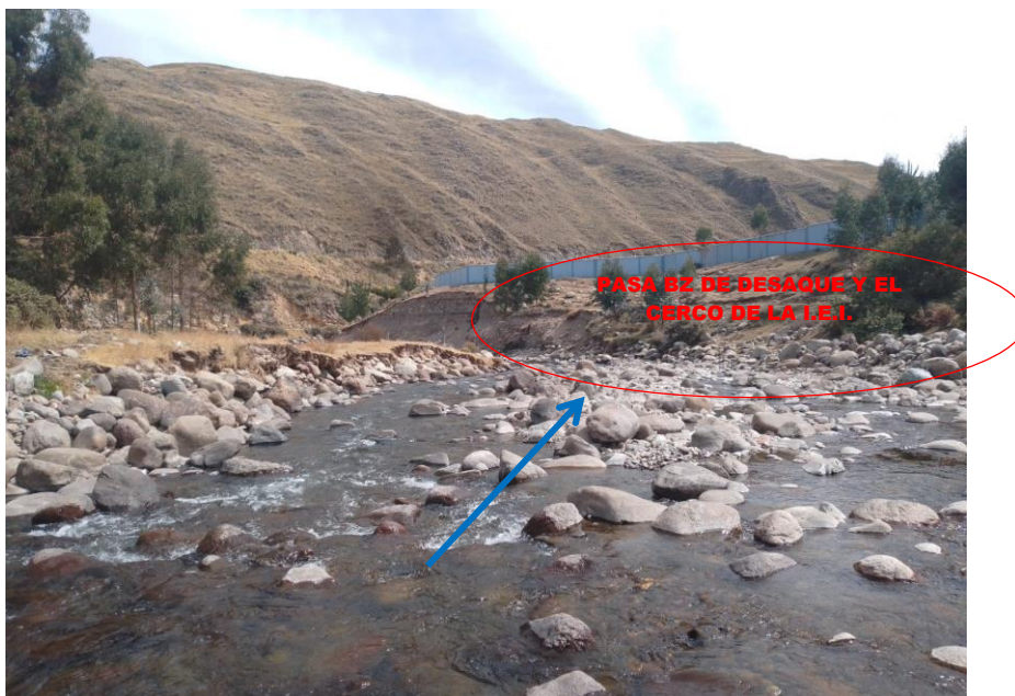
FIGURA N°02: POR LA PENDIENTE DEL CAUCE DE LA QUEBRADA CHAYCHAPAMPA, HAY RIESGO DE SOCAVAMIENTO Y POR TANTO CONSIGO DESLIZAMIENTO POR LA MARGEN IZQUIERDA Y ESTA LLEGA A DESEMBOCAR AL RÍO VELILLE.