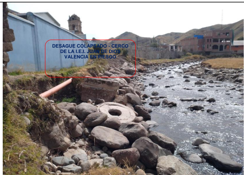
FIGURA N°01: TRAMO CRÍTICO EN LA QUEBRADA CHAYCHAPAMPA MARGEN IZQUIERDA, DISTRITO VELLILLO, PROVINCIA DE CHUMBIVILCAS - CUSCO