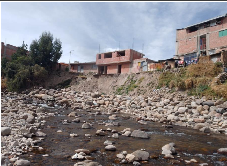
FIGURA N°03: EN LA MARGEN DERECHA SE ENCUENTRA AFECTACION A UNA VIVIENDA POR SOCAVAMIENTO Y CONSIGUIENTE DESLIZAMIENTO DE TALUD